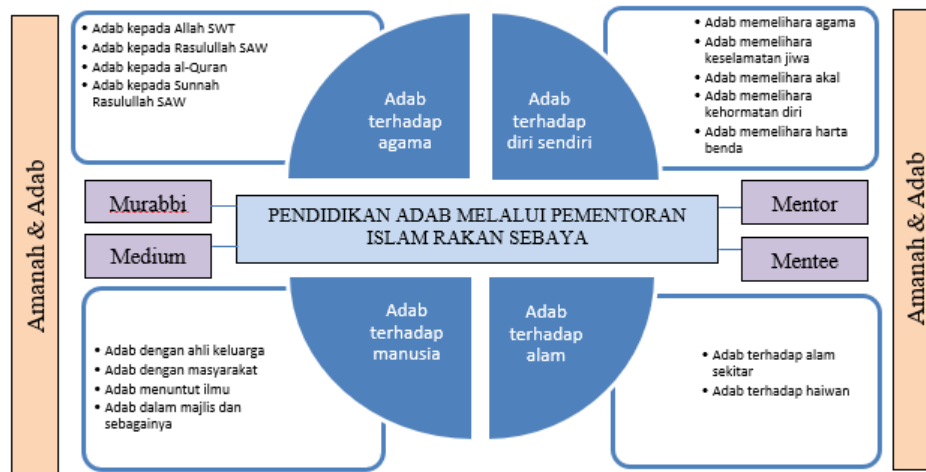
Rajah 3: Pendidikan Adab Melalui Pementoran Islam Rakan Sebaya di Era Society 5.0

Dalam pementoran Islam rakan sebaya yang berorientasikan pendidikan, aplikasi elemen adab dan amanah seperti mana dalam Pendidikan 5.0@UiTM wajar dipraktikkan. Ini meliputi adab murabbi dan mentor serta adab mentor dan mentee. Begitu juga elemen pendidikan adab yang diberi penekanan dalam kandungan adalah meliputi keseluruhan adab yang ditekankan oleh para ulama iaitu adab terhadap agama, adab terhadap diri sendiri, adab terhadap manusia dan juga adab terhadap alam sekitar. Dalam konteks amanah, pementoran Islam rakan sebaya merupakan amanah pendidikan Islam yang dipertanggungjawabkan kepada murabbi dan juga mentor dalam pelaksanaannya bagi membentuk mentee yang tinggi adab bagi merealisasikan pembentukan masyarakat sejahtera khususnya dalam era Society 5.0. Rajah 3 berikut menunjukkan gambaran umum peranan pementoran Islam rakan sebaya dalam pembinaan adab khususnya di era Society 5.0: