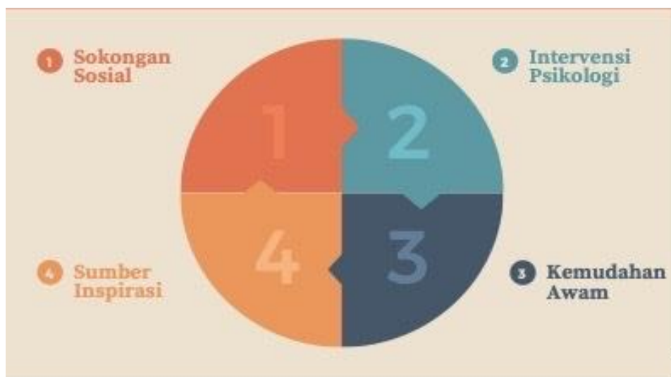
Rajah 2: Faktor Pelindung Luaran

Kajian yang dilakukan oleh Hendriani (2018), mendapati empat faktor pelindung luaran seperti yang digambarkan dalam Rajah 2, iaitu sokongan sosial, intervensi psikologi, kehadiran sumber inspirasi dan kewujudan kemudahan awam yang bersesuaian dengan OKU mampu meningkatkan resiliensi diri golongan OKU.