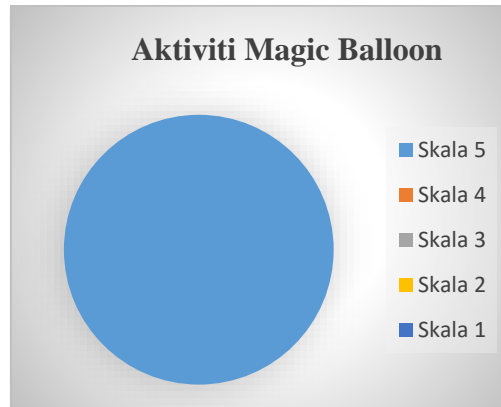
Rajah 1: Carta Pai Aktiviti Magic Balloon

Analisis data melibatkan proses pembersihan data. Data yang hilang atau tidak lengkap dikecualikan dalam analisa ini untuk mengelak daripada mempengaruhi hasil keseluruhannya. Oleh itu, hanya 43 borang soal selidik daripada 60 responden dianalisis. Hasil kajian dibawah dibahagikan kepada empat (4) carta pai mengikut kepada aktiviti-aktiviti yang dilaksanakan.