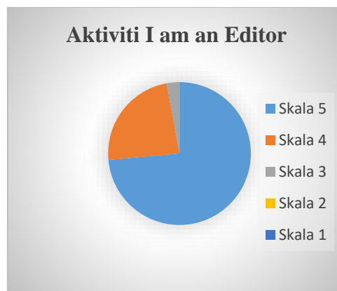
Rajah 2: Carta Pai aktiviti I am an Editor