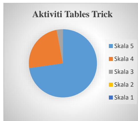
Rajah 4: Pie Chart aktiviti Tables Trick

Rajah 1 menunjukkan aktiviti magic balloon mencapai 100% iaitu semua responden memberikan skala 5. Semua responden sangat setuju dengan aktiviti ini dalam meningkatkan pengetahuan STEM dalam diri mereka. Mereka sangat berpuas hati dan gembira dengan aktiviti ini.